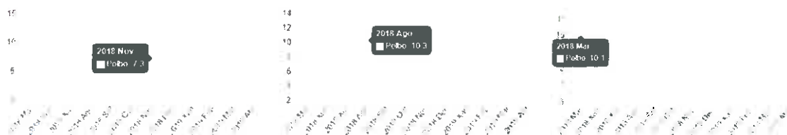
Evolución prezo do polbo, Lonxas de A Coruña, Camariñas e Ribeira.

Os prezos de alimentos e bebidas non alcohólicas, por unha banda, e de bebidas alcohólicas, por outra, incrementáronse respectivamente un 1,4% e un 1,6% en Galicia no ano 2018; esta suba enténdese xa repercutida no incremento dos prezos do sector de restauración sinalado anteriormente. Non procede facer corrección algunha derivada do singular incremento dalgún dos compoñentes do menú establecido. Particularmente, o polbo (que si supuxo un factor de coreción en 2018) non experimentou un especial incremento de prezo nos últimos 12 meses xa que o maior número de capturas fixo que se estabilizara o prezo tras un longo periodo de subas continuadas; particular que se pon de manifesto nos prezos medios de polbo das principais lonxas galegas: