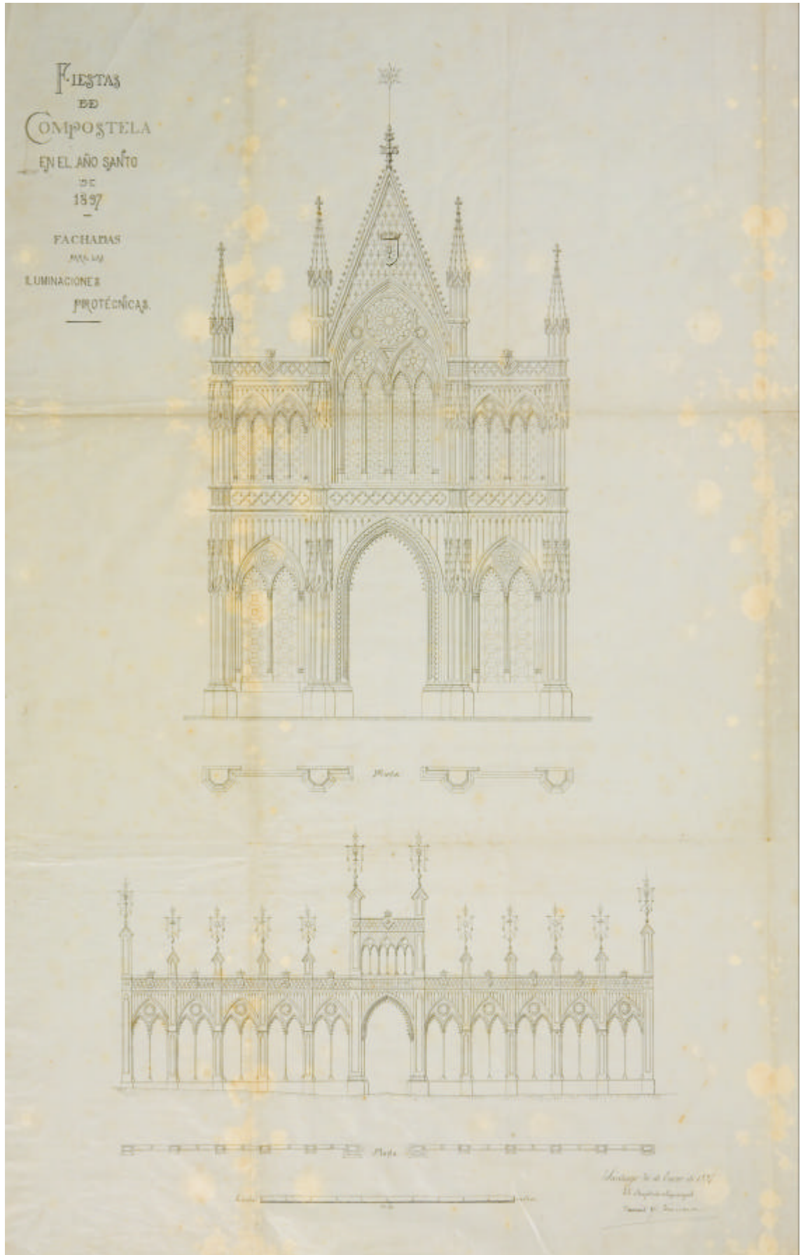
Traza de la fachada gótica de 1897.