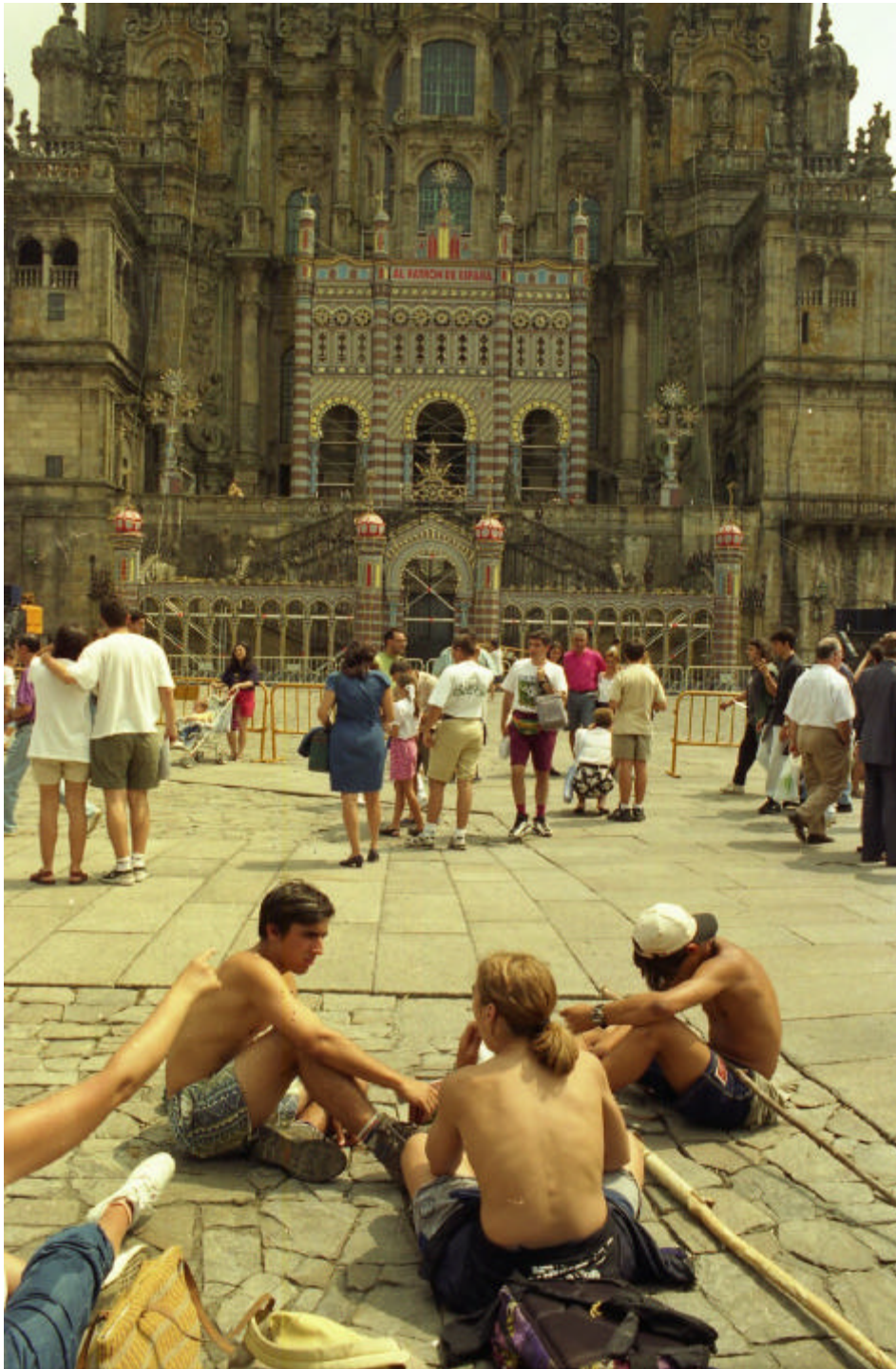
Fachada de Faustino Domínguez.